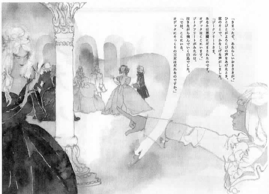
『はくちょうのみずうみ』でジークフリートが悪魔の娘を指さすシーン

今回、出版された4冊はちひろが40代後半から50歳に描いたもので、脂が乗りきっている時代の作品である。中でも『はくちょうのみずうみ』は、チャイコフスキーが好きな作曲家の一人であり、バレエの「白鳥の湖」も好きだったことから力を入れて描いている。舞台となる古城はヨーロッパスケッチ旅行の成果が生かされ、人物の表現では手や目の表情に工夫を凝らして、ドラマティックな場面を演出している。悪魔によって昼間は白鳥に姿を変えられているオデッタ姫に恋をしたジークフリート王子が、舞踏会で、オデッタに化けた悪魔の娘に求婚してしまった場面では構図の工夫が見られる。ジークフリートが「お前は誰だ!」というように悪魔の